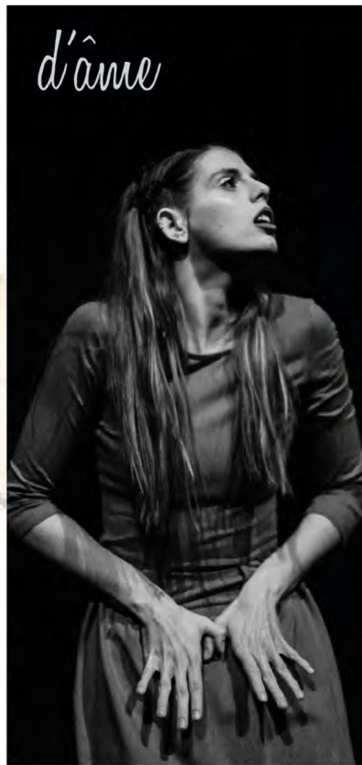
SOL FROID ET SENSATION DU MAL de Fleur